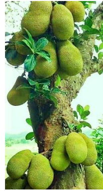
3)- പ്ലാവ് .....